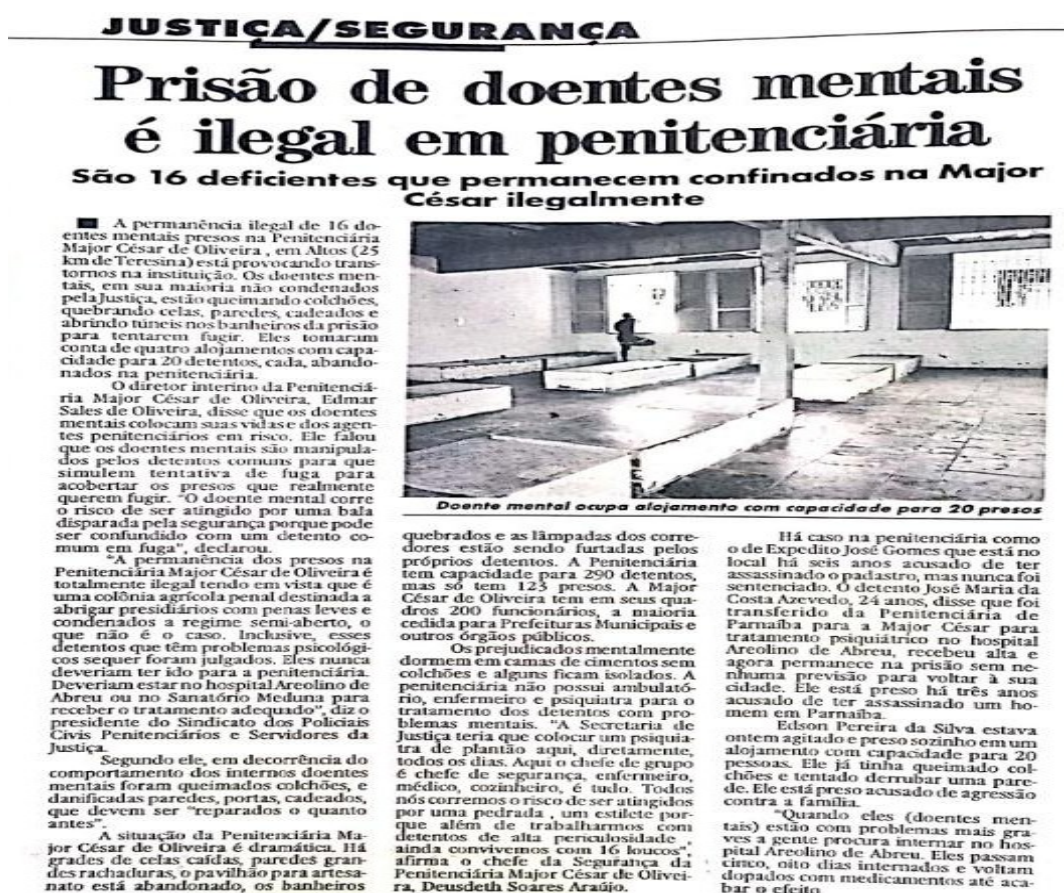
Figura 1: O Dia , página justiça/segurança, em 17 de junho de 1994